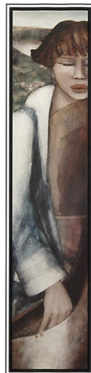
«Le Semeurs» Oeuvre de Roger Alexandre